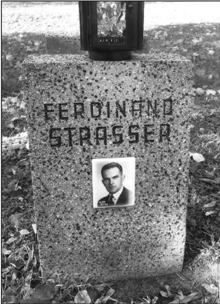
Grabstein von Ferdinand Strasser in der Gruppe 40 am Wiener Zentralfriedhof

unpolitisch darzustellen. Genützt hat ihm dies nichts. Wegen Vorbereitung zum Hochverrat wurden alle drei am 12. Juni 1942 vom nationalsozialistischen Volksgerichtshof zum Tode verurteilt. Das Urteil wurde am 30. September 1942 im Wiener Landesgericht vollstreckt.