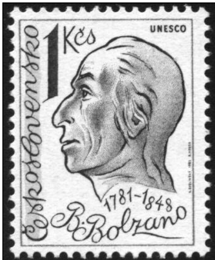
Tschechoslowakische Porträtmarke aus Anlass des Bolzano-Jahres

habe, gibt es solche Sonderbewilligungen eines zweiten Wohnsitzes in der DDR, die meine Bitte ermöglichen würde. Eine solche Großzügigkeit würde nicht nur das größte Geschenk zu meinem 80. Geburtstag sein, sondern wäre erst die Voraussetzung der Erfüllung Ihres telegraphischen Wunsches: ‚Viele Jahre Gesundheit und Erfüllung Ihres Lebens und Schaffens‘. In vertrauensvoller Verbundenheit stets Ihr EWinter m. p.“