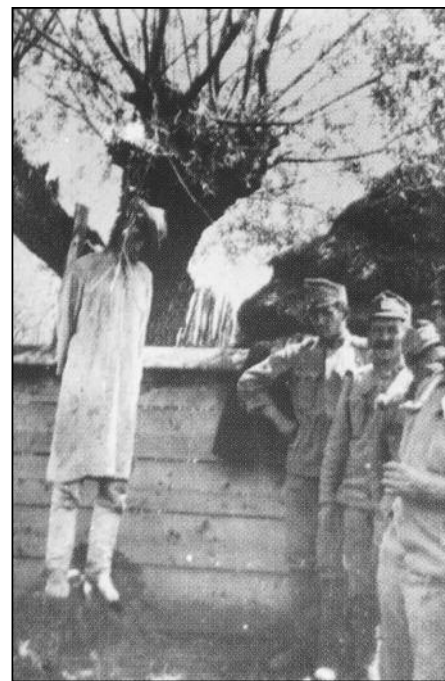
Ein Bauer wird im Nonstal im Trentino gehängt, weil er sich weigerte, den österreichischen Truppen Lebensmittel zur Verfügung zu stellen.

Georg Trakl erzählte kurz vor seinem Tod dem Innsbrucker Freund Ludwig von Ficker über seine furchtbaren Erlebnisse in einem galizischen Feldlazarett: „Aber so oft er in das Freie trat, immer habe ihn ein anderes Bild des Grauens angezogen und erstarren gemacht. Da standen nämlich auf dem Platz, der wirr belebt und dann wieder wie ausgekehrt schien, Bäume. Eine Gruppe unheimlich