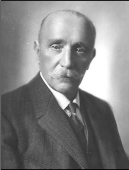
Franz Domes (1863–1930)

einem Rundschreiben an die Unternehmer am 17. November 1921 empfahl. Darin hieß es: „Das Betriebsrätegesetz ist strikte und einschränkend auszulegen.“ 12 Wobei die Betonung auf „einschränkend“ lag. Das bedeutete, dass die Vorsitzenden der Einigungsämter und vielfach auch deren Senatsmitglieder Sprüche in unternehmerfreundlichem Sinn fällten, sich auf den Standpunkt ihrer früher uneingeschränkten Herrenrechte im Betrieb stellten und das BRG so auslegten, dass möglichst willfährige Betriebsräte zustande kommen sollten.