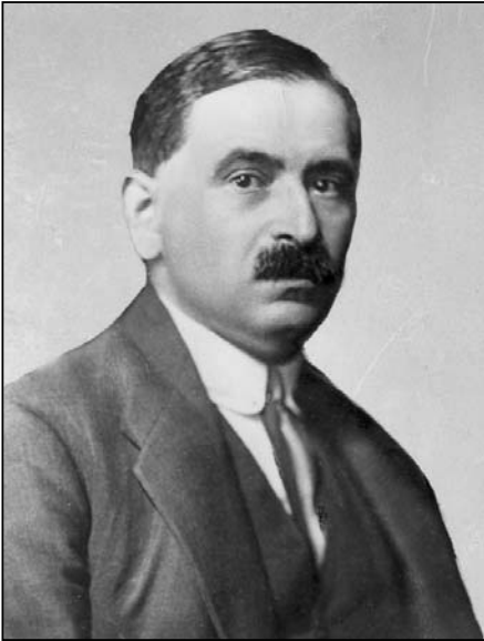
Otto Bauer (1881–1938)