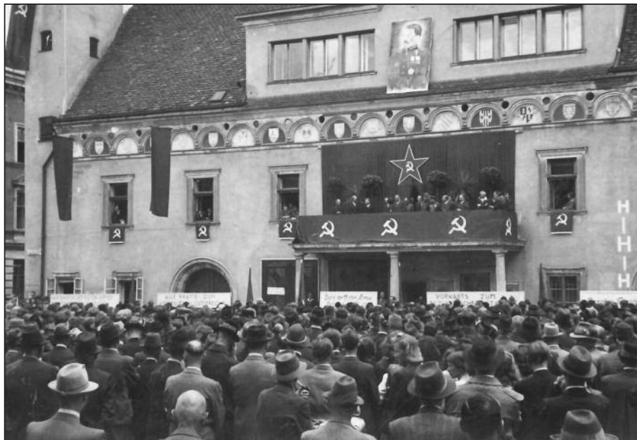
„Aufbau-Kundgebung“ in Leoben am 17. Juni 1945

Neben der Verhinderung von Plünderungen und Obstruktionen der Nationalsozialisten gehörten die Wiederingangsetzung des öffentlichen Lebens und der Wirtschaft zu den vorrangigen Aufgaben, die die ÖFF zu bewältigen hatte. So drohte etwa durch das Fehlen von Arbeitskräften – die ausländischen Arbeiter hatten unmittelbar nach der Befreiung den Bezirk teilweise bereits verlassen – in den ersten Tagen nach der Befreiung im Bergwerk Seegraben Feuer- und