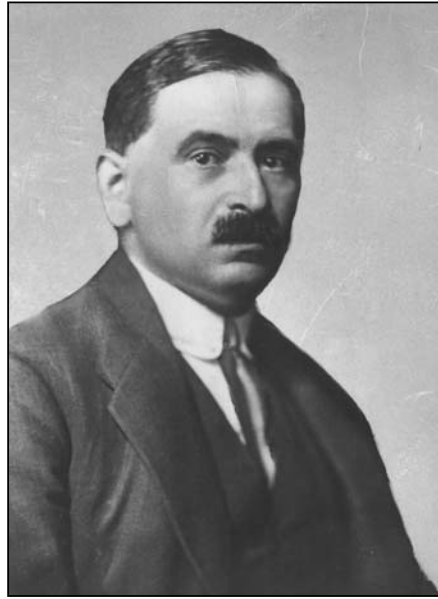
Otto Bauer (1881–1938)

linke“ wieder aktuell scheint: „So kann man bei seinem ‚historischen Fatalismus‘ anknüpfen, bei der Vorstellung eines automatischen Zusammenbruchs, eines ‚Weltgerichts‘, wo nicht die Arbeiterklasse mit dem Gegner abzurechnen habe, sondern zuvorkommend die Ge-