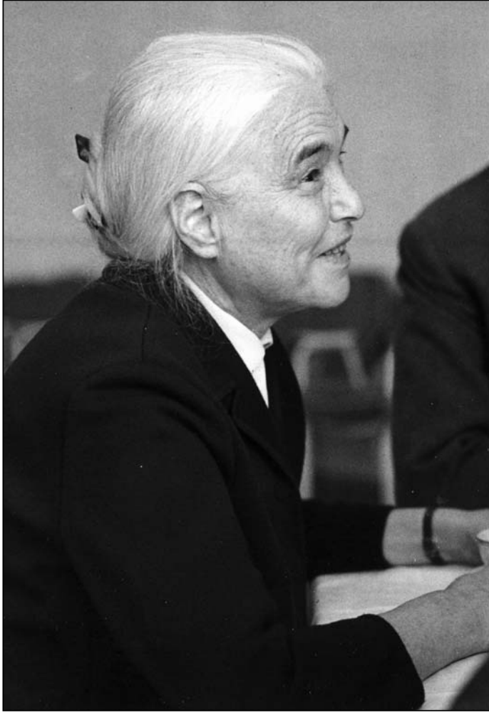
Anna Seghers auf der Konferenz des Deutschen Schriftstellerverbandes am 4. November 1966 in der Berliner Kongresshalle.

berechenbar. Ihr Versuch, so zu leben wie andere Leute, entfernt sie nur immer mehr von denen, und es geht ihnen wie ihrem Findlingen, dem Bergarbeiterdorf, wo sie zu Hause sind. ‚Die Menschen hatten auch an sonderbaren Stellen begonnen, die Erde umzugraben, um ein paar Bohnen zu ziehen oder Rhabarber, aber gerade dadurch wurde Findlingen einem richtigen Dorf immer unähnlicher.‘ Zu jedem Segen der Arbeit kommt der, dass sie die Wonne des Nichtstuns erst spürbar macht. Die Müdigkeit des Feierabends nennt Kant einen höchsten Genuss der Sinne. Müßiggang ohne Arbeit ist eine Qual. Zu jeder Entbehrung der Arbeitslosen tritt sie hinzu.“