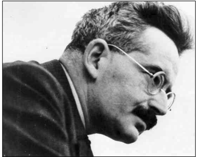
Walter Benjamin (1892–1940)

Benjamin sah, dass die sozialdemokratischen Parteien der II. Internationale früh mit dem rächenden revolutionären Erbe, mit „Spartacus“ brachen. Sichtbar war dies daran, dass der Name eines vom für den Sozialismus allein maßgeblichen Klassenhass geprägten Revolutionärs wie Auguste Blanqui aus der Erinnerung gestrichen wurde, dass spätestens nach dem Fall des Sozialistenverbots 1890 ein bieder sozialfriedlicher Reformismus im Sinn einer kleinbürgerlich guten Zukunft für die Enkel um sich griff. Benjamin fasst dies in einer der nachgelassenen Thesen zusammen: „Das Subjekt historischer Erkenntnis ist die kämpfende, unterdrückte Klasse selbst. Bei Marx tritt sie als die letzte geknechtete, als die rächende Klasse auf, die das Werk der Befreiung im Namen von Generationen Geschlagener zu Ende führt. Dieses Bewusstsein, das für kurze Zeit im ‚Spartacus‘ noch einmal zur Geltung gekommen ist, war der Sozialdemokratie von jeher anstößig. Im Lauf von drei Jahrzehnten gelang es ihr, den Namen eines Blanqui fast auszulöschen, dessen Erzklang das