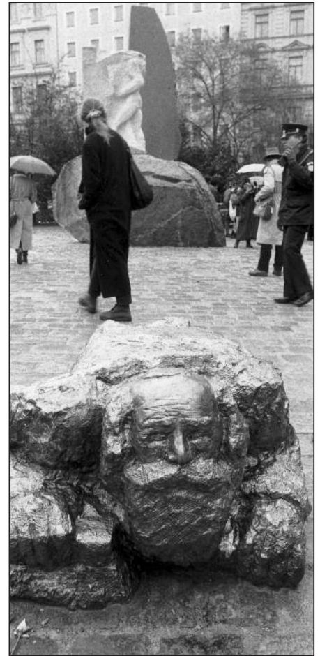
„Denkmal gegen Krieg und Faschismus“ von Alfred Hrdlicka am Wiener Albertinaplatz. Im Vordergrund der „straßenwaschende Jude“.