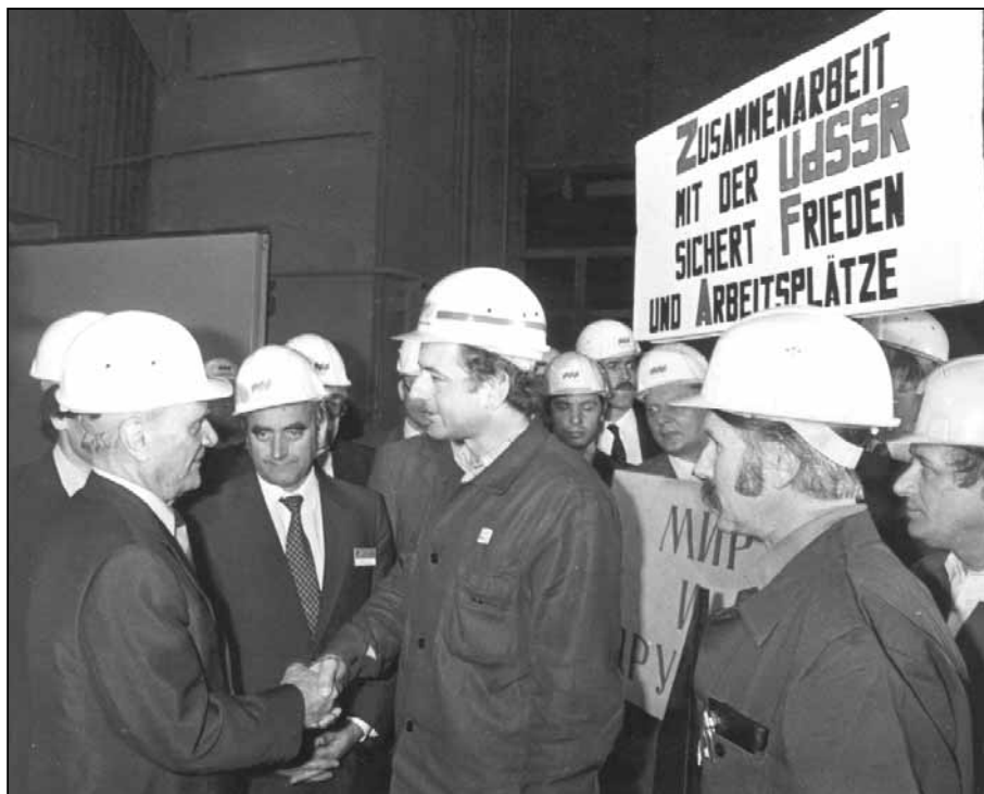
Der sowjetische Ministerpräsident Tichonow wird im April 1981 im VOEST-Alpine-Werk III von einer Abordnung der KPÖ-Betriebsorganisation begrüßt.

Der zweite Versuch mit ähnlicher Stoßrichtung geriet etwas erfolgreicher, ohne jedoch noch eine wirkliche Bresche in den verstaatlichten Bereich zu schlagen. Er ging vom ÖVP-Finanzminister Kamitz unter dem Motto „Volkskapitalismus“ aus. Dieser ideale Gesellschaftszustand, in dem es nur noch Generäle und kein gemeines Soldatenfußvolk mehr gibt, sollte durch die Emission von „Volksaktien“ herbeigeführt werden, von Aktien mit niedrigem Nennwert, die – so behauptete man – vom „kleinen Mann auf der Straße“, vom Arbeiter, Geschäftsmann, von der Hausfrau und so weiter gekauft werden würden. Auf diese Weise würde das Volk und nicht mehr der Staat